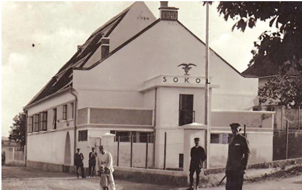
Sokolovna, dokončená v r. 1926 přestavbou z bývalé sýpky