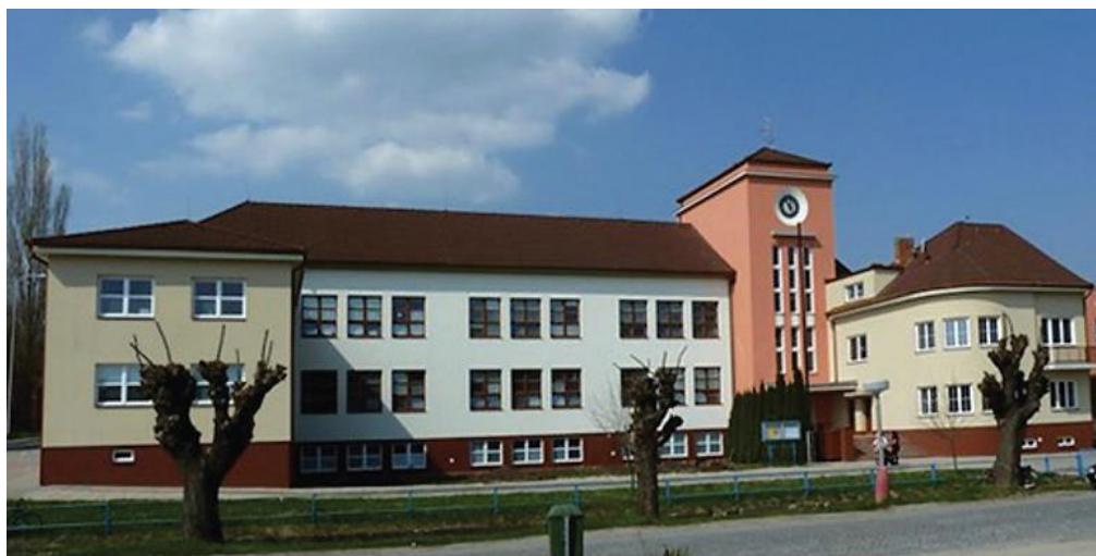
Současná podoba MZŠ – č. 1

Jeho nejvýznamnějším návrhem byla budova nynější Masarykovy základní školy.