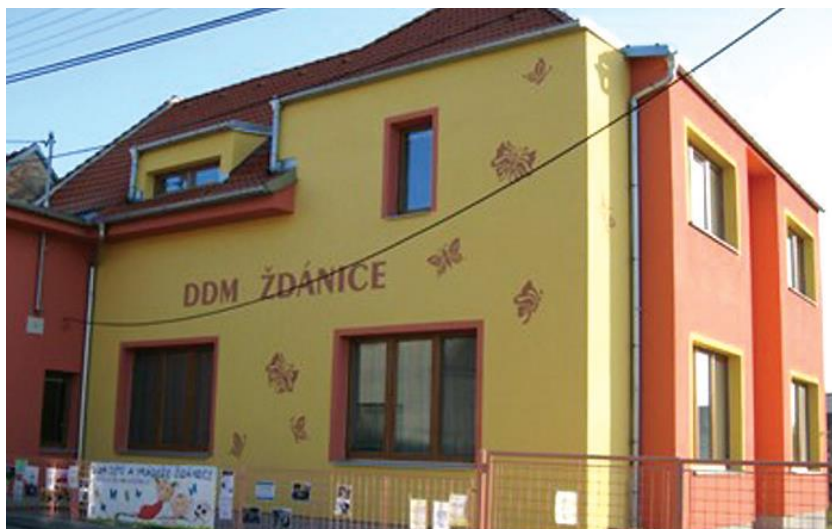
Vila pro dr. Břouška, dnešní dům dětí a mládeže – č. 2