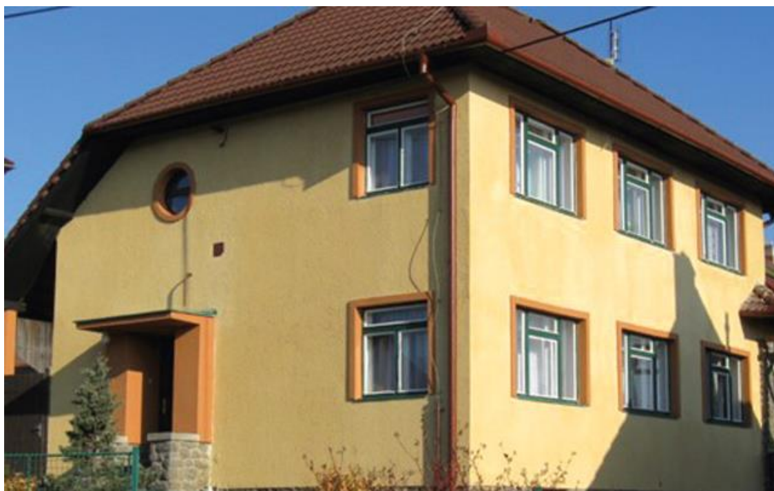
Dům pro rodinu Krátkou – č. 5