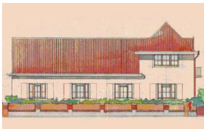
Návrh domu pro bratra Karla a jeho současný stav – č. 3