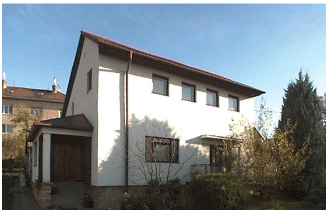
Dům pro rodinu Hanáčkovou – č. 6