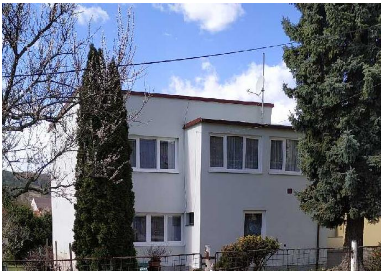
Vila pro Eduarda Krulíčka - č. 4