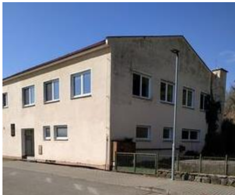
Současný stav - na začátku Sokolské ulice, vedoucí k DDM