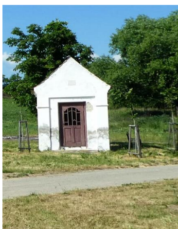
Kaplička sv. Floriana