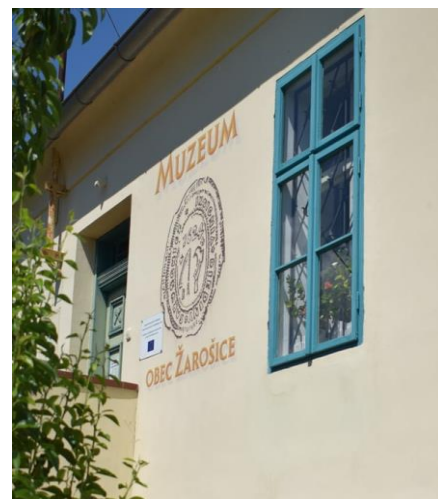
Muzeum obce Žarošice