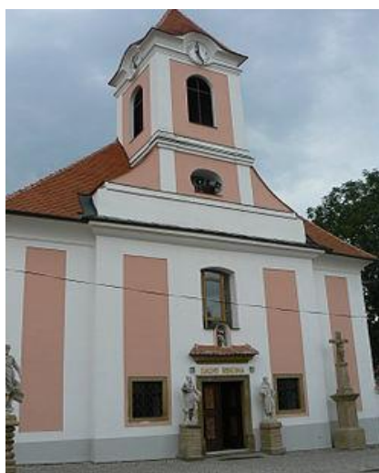
Poutní kostel sv. Anny