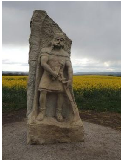
Náklo - pískovcové sochy