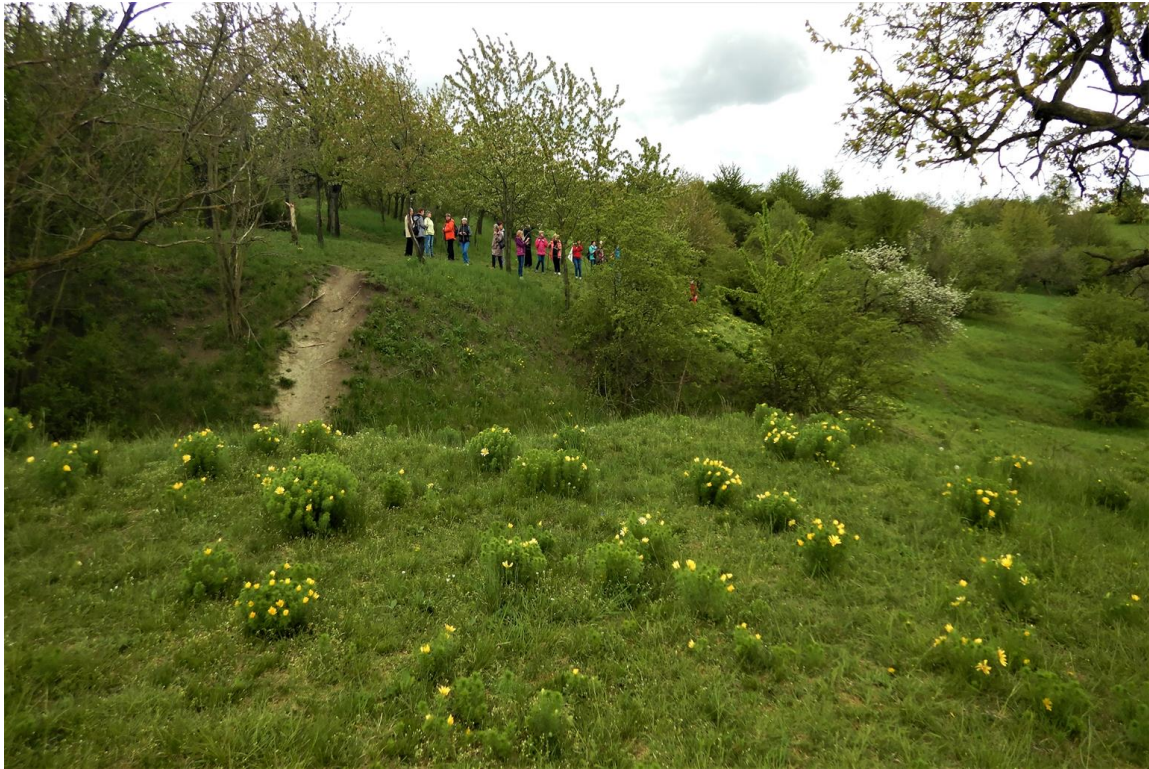
Přírodní rezervace Horky