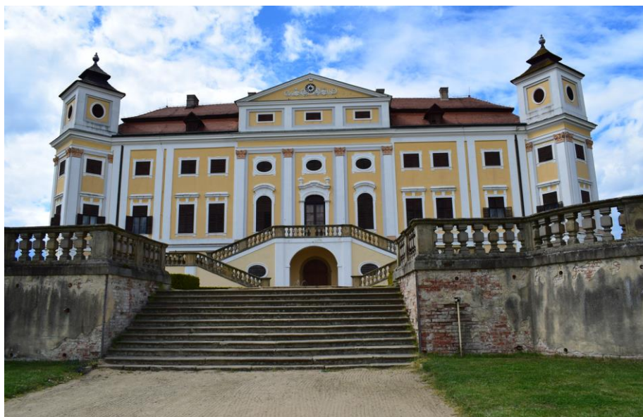
Barokní zámek Milotice

Prošlapala : Stonožka Spolku seniorů Ždánice