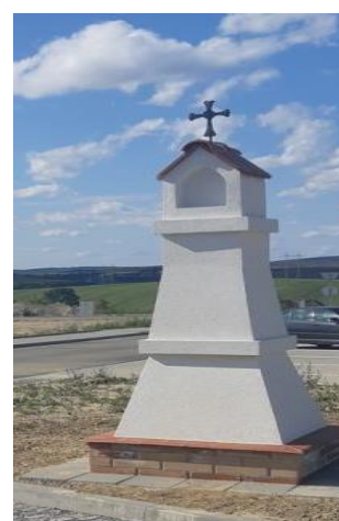
Kaplička v nové zástavbě