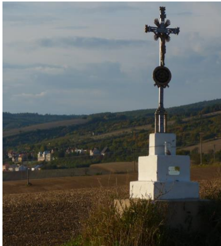
křížek s výhledem na Ždánice