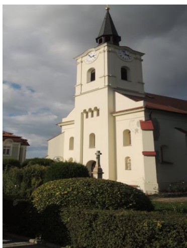
kostel sv. Sebastiana