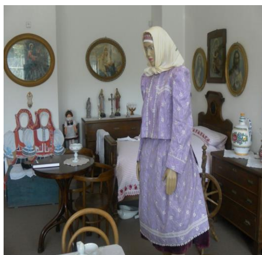
Muzeum obce Věteřov