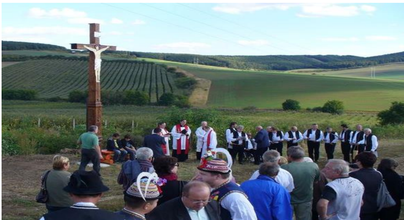
Fotografie je ze svěcení Végrova kříže (2012)

(autoři textu Ing. Libor Konečný, Ing. Petr Konečný)