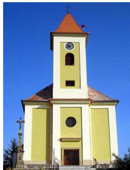
kostel sv. Petra a Pavla v Lovčicích