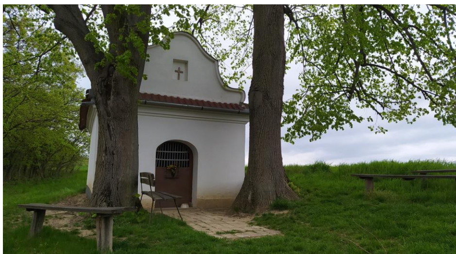
Kaple Panny Marie v Kučích