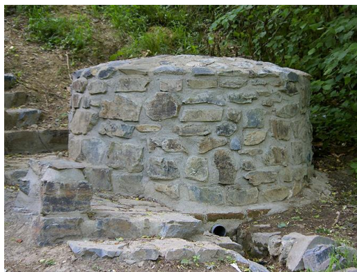
Studánka s pramenem