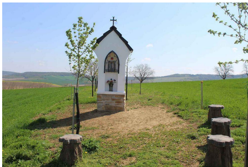
Výklenková kaple sv. Anežky České

Prošlapala: Stonožka Spolku seniorů Ždánice