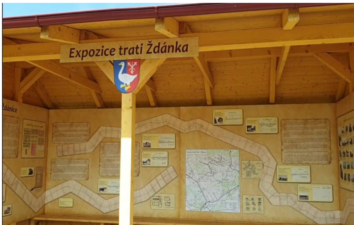
Expozice trati Ždánka u cyklostezky v Dražůvkách