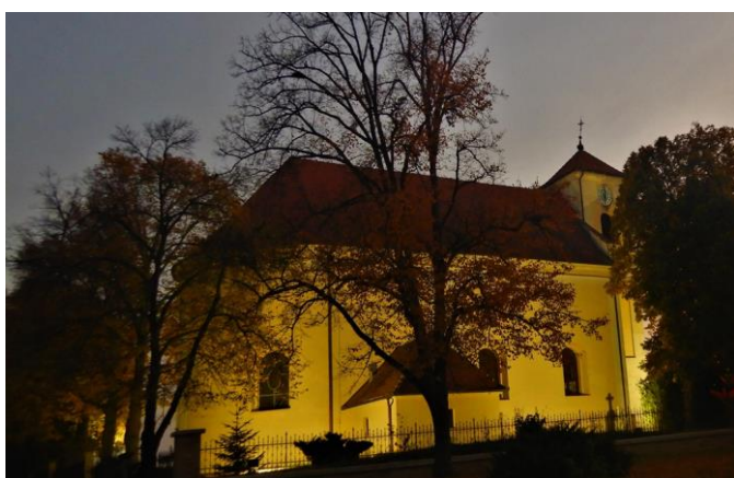
Zpáteční cestou do Ždánic kolem kostela v Archlebově