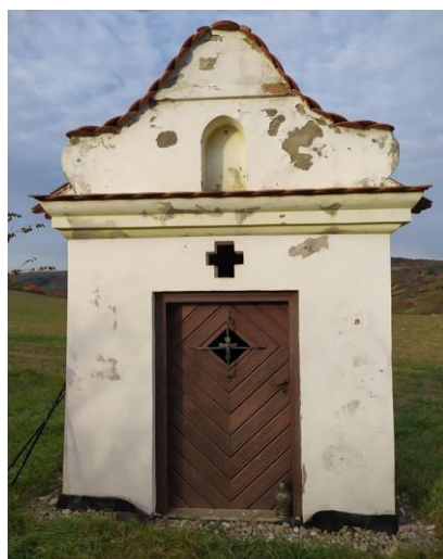
Kaple Panny Marie