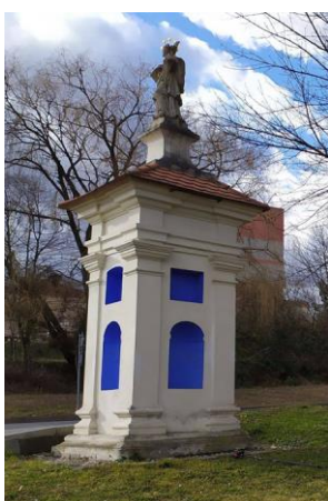
Boží muka se sochou sv. Jana Nepomuckého