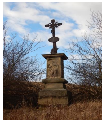
Kříž u polní cesty do Archlebova