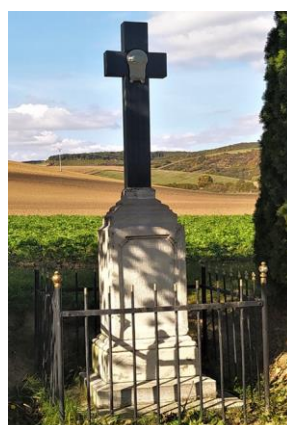
Kříž u cesty