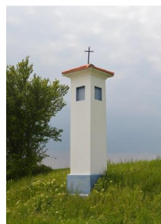
Boží muka nad Ždánicemi