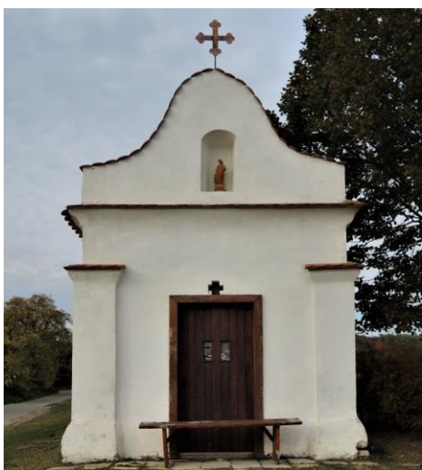
Barokní kaple V Járu