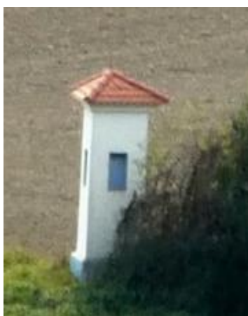
Trojboká Boží muka u koupaliště