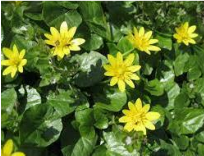
Orsej jarní - č. 3