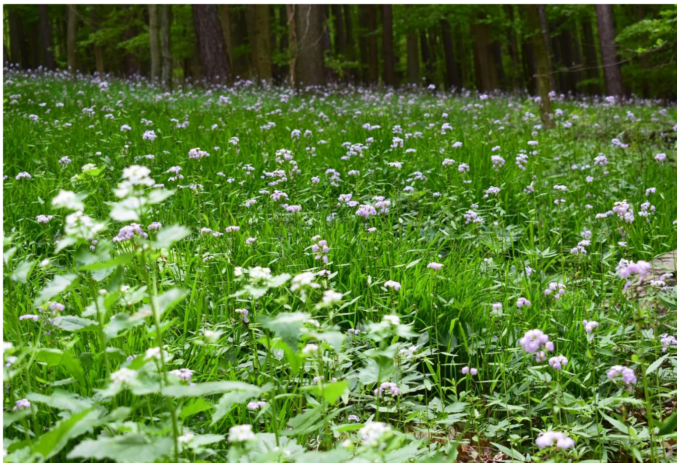
Květnatá bučina - č. 7