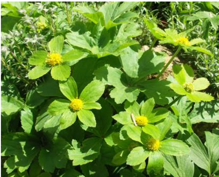
Hvězdnatec čemeřicovitý - č. 5