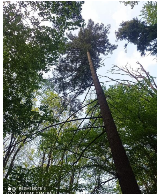
Douglaska tisolistá - č. 6

V místě trasy u č. 6 narazíme na několik stromů douglasky tisolisté (severoamerický druh), vysazených před 80 -100 lety.