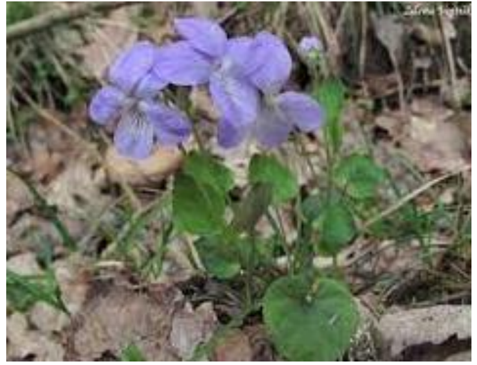
Violka Rivinova - č. 4