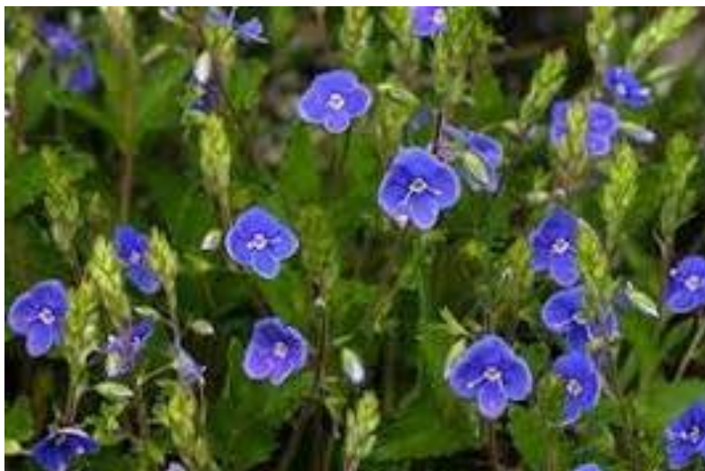
Rozrazil rezekvítek - č. 2