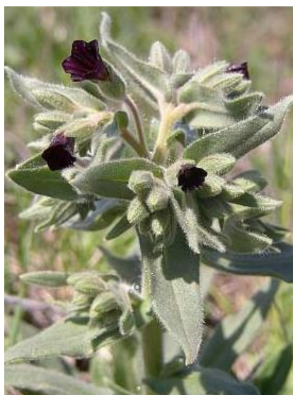
Pipla osmahlá - č. 1